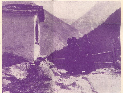
Dans la vallée de Saas-Fée.

Nous sommes certains que ce film aura un très grand succès à Genève et qu'il inaugurer dignement la nouvelle salle de la rue de Rive.