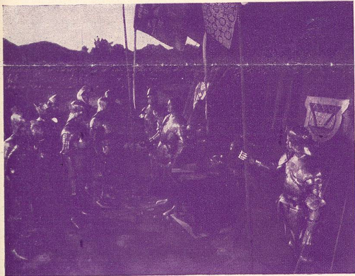
Avant la bataille de Sempach (1386).

Grande œuvre filmée sur l'origine et la beauté pittoresque de l'Helvétie.