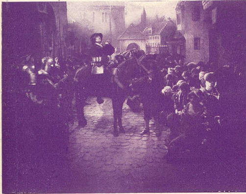
Prière de Zwingli avant la bataille de Kappel.