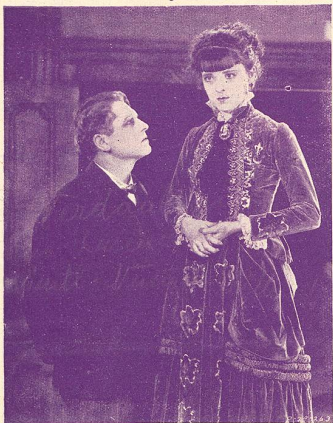
MON GRAND (Mater Dolorosa)

VOTRE PUBLIC SERA EMBALLÉ PAR L'INTERPRÉTATION DE