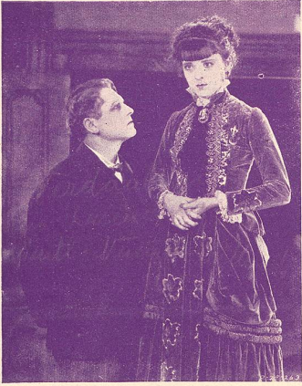
MON GRAND (Mater Dolorosa)

VOTRE PUBLIC SERA EMBALLÉ PAR L'INTERPRÉTATION DE