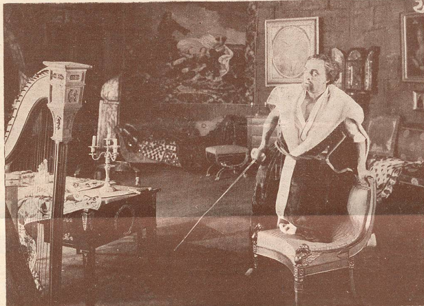
Une scène du film Le Comte Kostia .

la belle artiste écossaise qui joue pour la Fox Film et que nous avons admirée dans Hors du Gouffre .