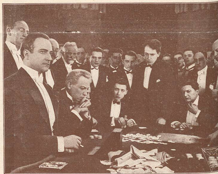
Une scène du film Le Double Amour qui passe cette semaine au CINEMA-PALACE à Lausanne, avec Jean Angelo à gauche de l'image.

Le rôle qui lui a été assigné dans Le Double Amour lui convenait parfaitement; elle le remplit avec le talent qu'on lui connaît et personnifie la douleur sans aucune exagération mimique.