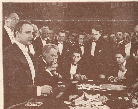
Une scène du film Le Double Amour qui passe cette semaine au CINÉMA-PALACE à Lausanne, avec Jean Angelo à gauche de l'image.

le célèbre acteur allemand que nous verrons cette semaine au THEATRE LUMEN dans le rôle du Comte Kostia .