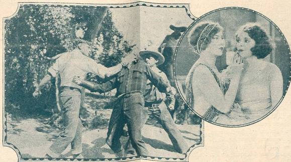
Une scène du film Le Gagnant prend Tout. Une remarquable production de la Fox Film.

Ce film tiré par Jean Epstein de la nouvelle d'Alphonse Daudet déborde de sentiment, un de ces amours d'enfants qui font mourir. Un enfant adopté à vécu heureux, sur La Belle Nivernaise , une barque de canal, goûtant à toutes les joies de la liberté et de la douce affection. Une compagnie de jeux et de travaux éclaira sa jeunesse. Mais son père le retrouve, le reprend, le retire à son bonheur. Il le met au Collège. L'enfant s'ennuie, souffre, pense au chaland perdu, à la sœur de son cœur, à son tendre amour. Il tombe malade, il va mourir. Sa famille adoptive vient le voir au chevet de son lit blanc d'infirmerie. Son père le rend à ceux qui seuls ont pu faire son bonheur. La trame est simple, aussi simple, aussi ingénue de ce sentiment juvénile. C'est du bon cinéma populaire qui attendrit et qui plaît. La Maison du Peuple ne pouvant mieux choisir son programme qui est complété par une comédie amusante, Deuxes carresses et une très belle revue encyclopédique Pathé, toujours instructive.