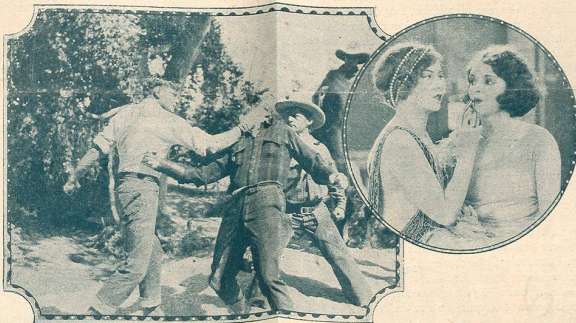
Une scène du film Le Gagnant prend Tout. Une remarquable production de la Fox Film.

Ce film tiré par Jean Epstein de la nouvelle d'Alphonse Daudet déborde de sentiment, un de ces amours d'enfants qui font mourir. Un enfant adopté à vécu heureux, sur La Belle Nivernaise , une barque de canal, goûtant à toutes les joies de la liberté et de la douce affection. Une compagnie de jeux et de travaux éclaire sa jeunesse. Mais son père le retrouve, le reprend, le retire à son bonheur. Il le met au Collège. L'enfant s'ennuie, souffre, pense au chaland perdu, à la sœur de son cœur, à son tendre amour. Il tombe malade, il va mourir. Sa famille adoptive vient le voir au chevet de son lit blanc d'infirmerie. Son père le rend à ceux qui seuls ont pu faire son bonheur. La trame est simple, aussi simple, aussi ingénue de ce sentiment juvénile. C'est du bon cinéma populaire qui attendrit et qui plaît. La Maison du Peuple ne pouvant mieux choisir son programme qui est complété par une comédie amusante, Deuxes carresses et une très belle revue encyclopédique Pathé, toujours instructive.