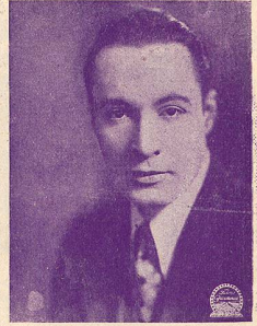
R. LA ROCQUE. une vedette de la Paramount