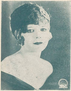
V. REYNOLDS une vedette de la Paramount