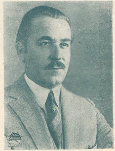
NOAH BEERY une vedette de la Paramount