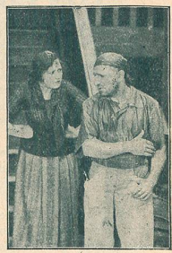
Une scène de La Nuit de la Revanche Vanel, chef des contrebandiers.