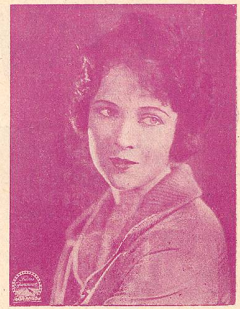
LOGAN une vedette de la Paramount

ADMINISTRATION et RÉGIE DES ANNONCES : Avenue de Beaulieu, 11, LAUSANNE — Téléph. 82.77 ABONNEMENT : Suisse, 8 fr. par an ; 6 mois, 4 fr. 50 :: Etranger, 13 fr. :: Chèque postal N° 11. 1028 RÉDACTION : L. FRANÇON, 22, Av. Bergières, LAUSANNE :: Téléphone 35.13