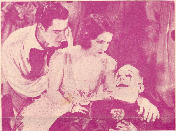
La mort du Clown (Lon Chaney).

Voici en quelques mots l'histoire que nous allons voir à l'écran : Un savant abandonné par sa femme et spolié par un rival sans scrupule est devenu clown dans un cirque de province. Il est l'Homme qui reçoit des gifles (c'est sous ce titre que ce film passe en Amérique). Il s'prend d'une jeune écuycère que son père, un noble taré, veut marier, ou plutôt veut vendre, à celui qui l'a dépouillé (encore une victime aristocratique pour apaiser le Moloch de la démocratie). Mais la jeune fille ne le prend pas au sérieux (le clown et non le dieu qui mange du noble). Cependant le clown veut assurer le bonheur de celle qu'il