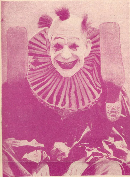
LON CHANEY dans „Larmes de Clown.“