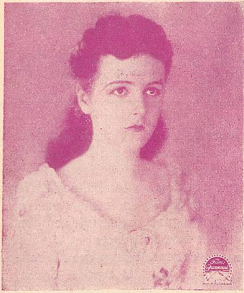
M. ASTOR une vedette de la Paramount