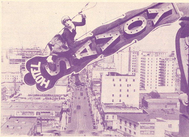
(Dorothy DEVORE) Une des scènes angoissantes de HOLD YOUR BREATH

Ce soir-là, Larouque, tout à ses soucis matériels, tarda longtemps à rentrer auprès de sa chère femme Henriette et de sa fille Suzanne. L'heure du dîner était passée depuis longtemps ; la mère et la fille attendaient à la véranda lorsqu'elles virent les fenêtres de Larouette s'éclairer