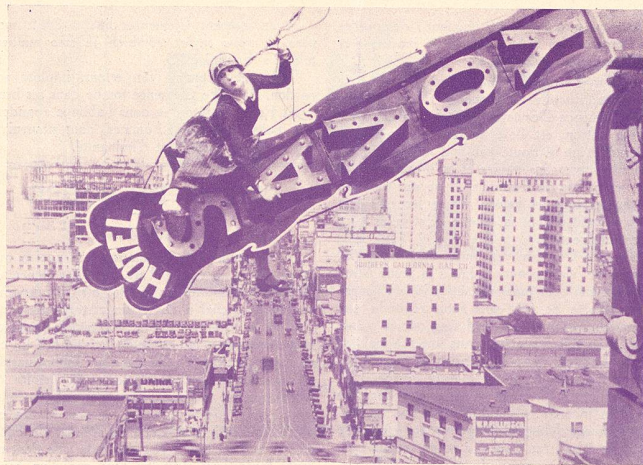
(Dorothy DEVORE) Une des scènes angoissantes de HOLD YOUR BREATH

Ce soir-là, Larouette, tout à ses soucis matériels, tarda longtemps à rentrer auprès de sa chère femme Henriette et de sa fille Suzanne. L'heure du dîner était passée depuis longtemps ; la mère et la fille attendaient à la véranda lorsqu'elles virent les fenêtres de Larouette s'éclairer