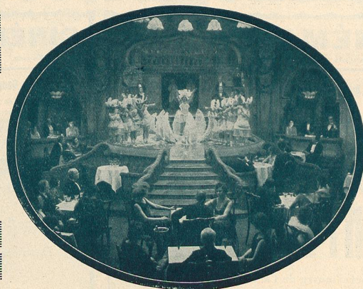
Une autre scène du film UN RÊVE DE BONHEUR.