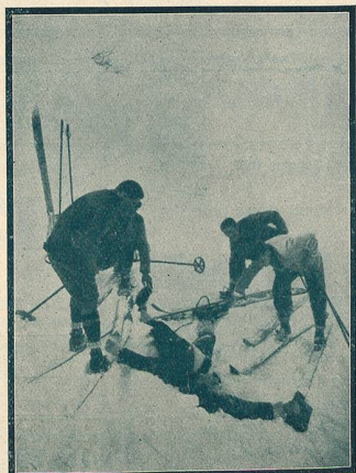
Une scène du film UN RÊVE DE BONHEUR.