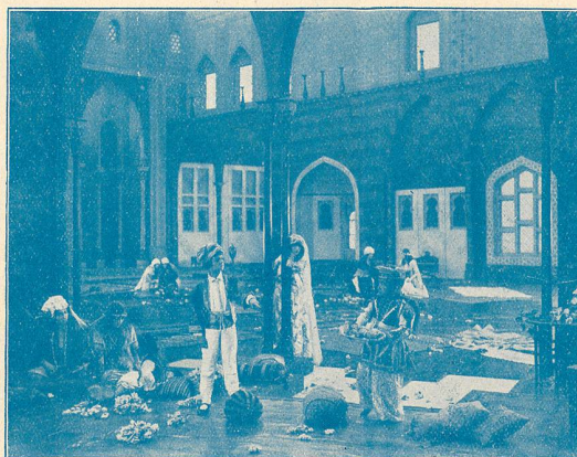
La Femme de l'Orient.