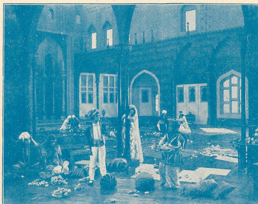
La Femme de l'Orient.