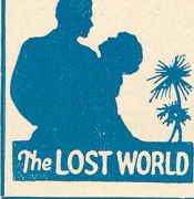
The LOST WORLD