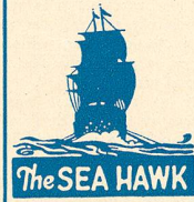
The SEA HAWK