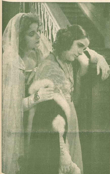
Une scène de La Légende de Gösta Berling.