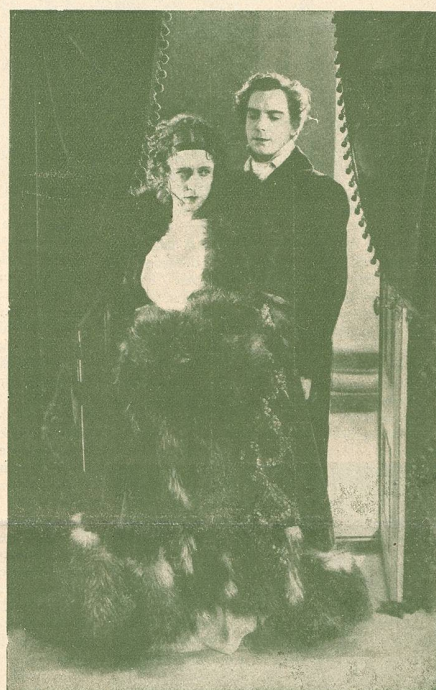
LARS HANSON et JENNY HASSELOQUIST dans La Légende de Gösta Berling.