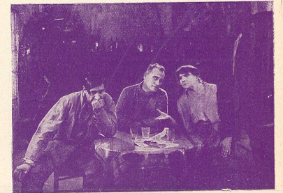
Les Deux Gosses