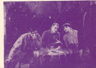
Les Deux Gosses