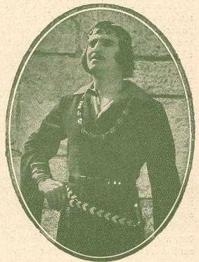
DOUGLAS FAIRBANKS dans ROBIN DES BOIS

A vant de partir aux Croisades, Richard Cœur-de-Lion a convié tous ses chevaliers à venir déployer leur force et leur valeur dans un grand tournoi. Il a décidé de donner au vainqueur de la fête le commandement général de la Croisade. Les deux plus redoutables champions sont Guy de Gisbourne, homme ambitieux, sans scrupule, et le Comte de Huntingdon, favori du roi. Après les premières passes d'armes, Gisbourne et Huntingdon se trouvent face à face. Leur rencontre est terrible, mais Huntingdon finit par triompher, et au milieu des acclamations générales, Richard Cœur-de-Lion le proclame commandant-chef des croisades. Fêtes... Banquets... Au milieu de toutes ces réjouissances, Richard constate avec tristesse que Huntingdon, au lieu de rechercher la présence de quelque demoiselle, préfère la société des soldats. Le Roi fait attacher Huntingdon à une colonne de pierre et déclare qu'il est prêt à doter en terres, château et écus celle qui, parmi les dames de la cour, saura