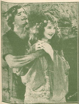
DOUGLAS FAIRBANKS dans ROBIN DES BOIS