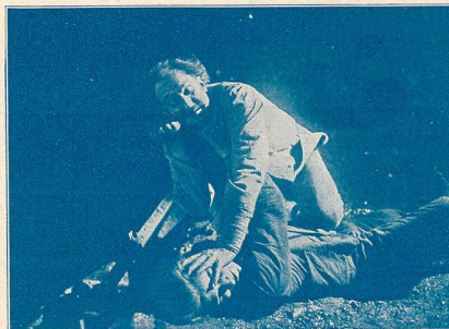
Une scène de Sarati le Terrible . Sarati se trouve sur le même bateau que Gilbert, une lutte s'engage entre les deux irréconciliables ennemis...