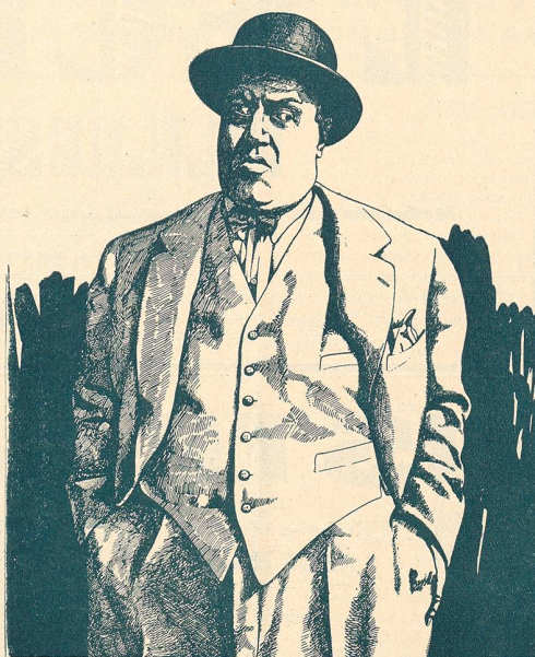
Emile JANNINGS dans L'OR HOMICIDE