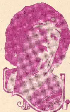
MARGUERITE DE LA MOTTE

Dans Les Dix Commandements , que nous venons de voir, il crée l'imposante figure de Ramsès II.