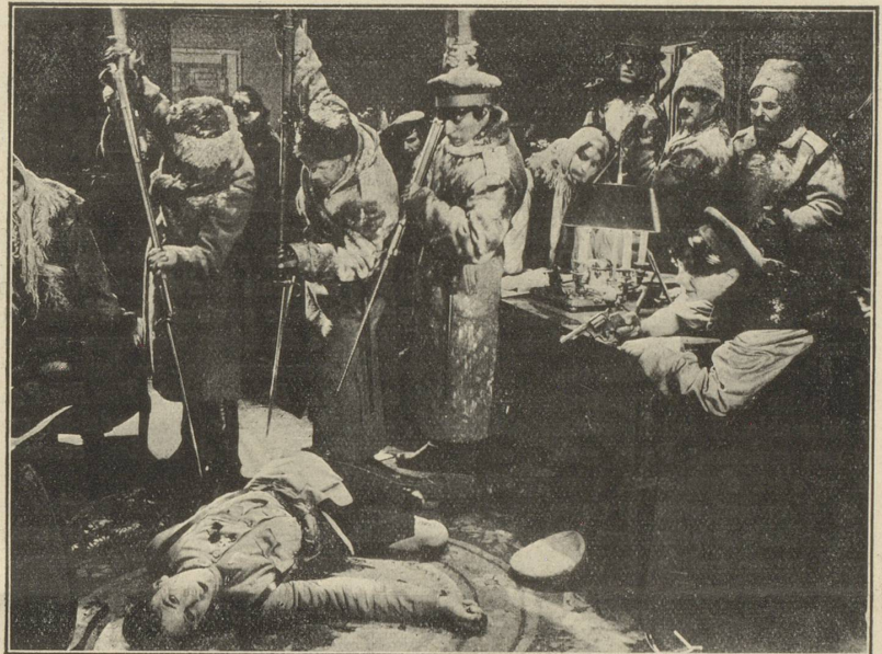
Une scène du film « LE VERTIGE » qui passe au LUMEN