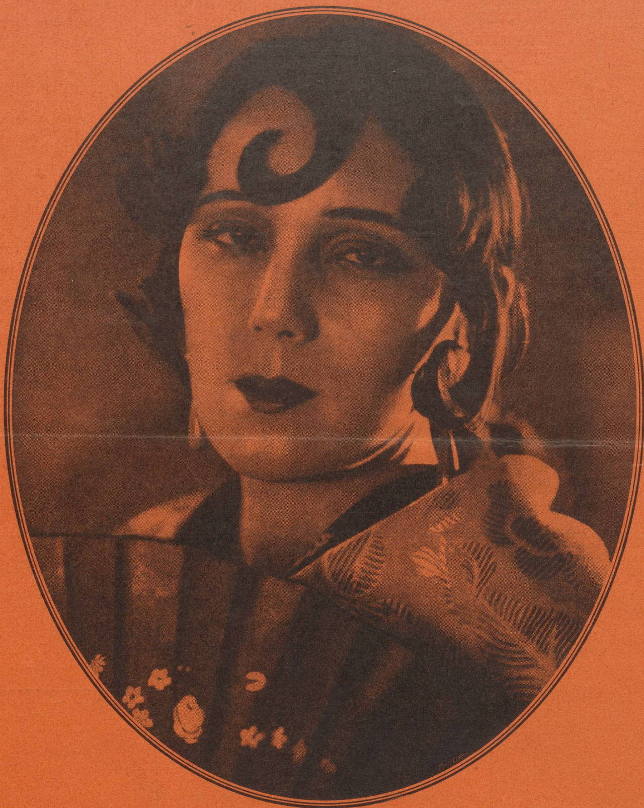
RAQUEL MELLER dans « Carmen »