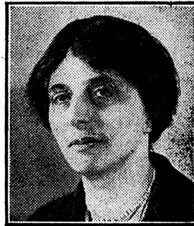
La duchesse d'ATHOLL

Députée au Parlement anglais. - Ex Secrétaire parlementaire au Ministère du Travail.