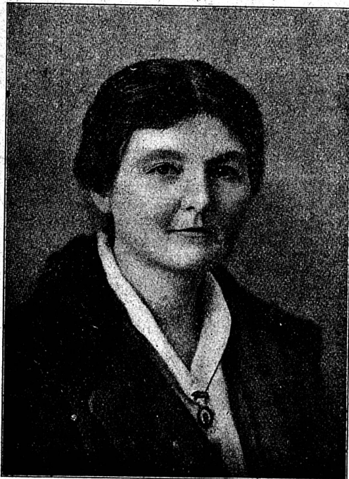
Miss Margaret BONDFIELD

La loi d'émancipation de 1918 a eu pour résultat l'adoption, en deux ans, de plus de lois concernant l'amélioration de la situation des femmes que pendant les vingt années précédentes.