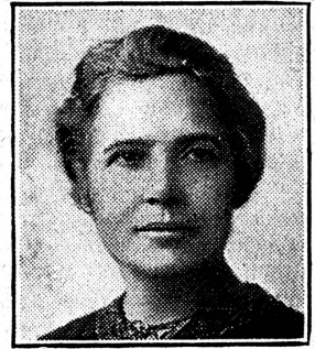
Miss Susan LAWRENCE

Secrétaire parlementaire au Ministère de l'Instruction publique