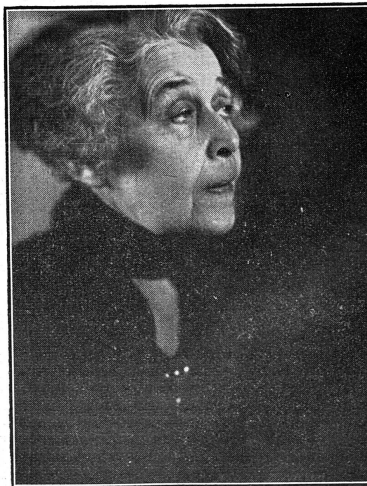
Cliché Jus Suftragli.

Résultats du plus haut intérêt, aussi bien du point de vue technique que du point de vue social. Non seulement l'étoffe est excellente et la coupe parfaite, mais la confection, si difficile, est extrêmement soignée et réussie en tous points, nous a assuré une spécialiste. Une trentaine de femmes sont occupées à domicile à cette confection, qui ont d'abord fait un apprentissage dans un atelier installé à cet effet. Elles gagnent,