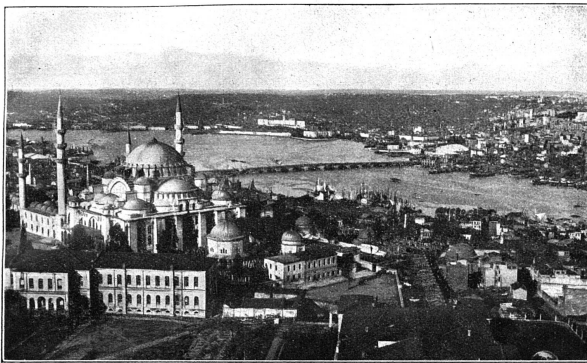
Istanbul, Mosquée de Suleyman et la Corne d'Or

ABONNEMENTS SUISSE . . . . . Fr. 5.— ÉTRANGER . . . . . 8.— Le numéro . . . . . 0.25 Les abonnements partent du 1 er janvier. À partir de juillet, il est différé des abonnements de 6 mois (3 fr.) établis pour la somme de l'année en cours. ANNONCES La ligne ou son espace : 40 centimes Réductions p. annonces répétées