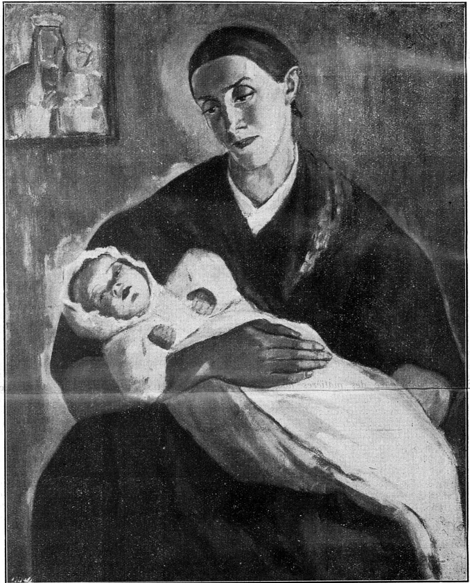
Par Illy Kjaer, artiste autrichienne