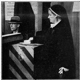
Le geste qu'aucune femme ne saurait accomplir sans perdre immédiatement toutes ses qualités...

Du point de vue féministe encore, qui nous intéresse surtout ici, il est intéressant de relever que, comme nous avions déjà eu l'occasion de le constater, il y a quatre ans, lorsque les