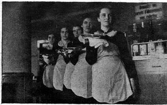
Service aimable, malgré la suppression des pourboires

Le Foyer de Soutiens ne se contente pas d'abriter les pupilles du Service social pendant une période d'observation, mais il garde aussi les cas difficiles pour une période de rééducation. Il peut recevoir 45 élèves, et avait, à la date de juillet 1934, 6 filles et 14 garçons en observation, 10 filles et 7 garçons en rééducation. Les classes sont mixtes; les groupes d'observation sont réunis dans une classe de sondage, où