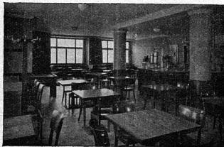
Cliché Le Carillon