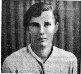
Barbara WOOTTON

On le voit, la conférencière que nous avons eu le privilège d'entendre à La Haye est une économiste de premier ordre. Mais à côté de sa science si sûre, et si personnelle, dirai-je, parce que si réfléchi et si solidement étayé sur ses recherches et ses réflexions, ce que nous, profanes, apprécions aussi chez Mrs Wootton, c'est son incomparable talent d'exposition. Avec elle, l'économie politique, la statistique, la sociologie, la politique ne sont jamais ni arides ou abstraites, mais au contraire lumineuses de clarté, et palpitantes de vie. On l'écoute comme on entendrait une belle histoire, incroyablement vraie, qui plonge ses racines dans notre vie de tous les jours, et dont les enseignements nous soulèvent au-dessus de nous-mêmes en nous aidant à comprendre la valeur pour la communauté des phénomènes les plus courants de notre existence journalière. Et les deux noms de maîtres qui viennent tout naturellement à notre pensée, en évoquant les dons intellectuels de Barbara Wootton, montreront bien comment nous n'hésitons pas à la comparer avec