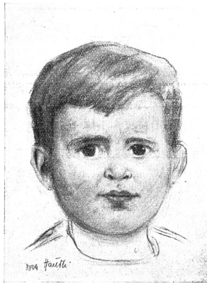
Cliché Pro Juventute