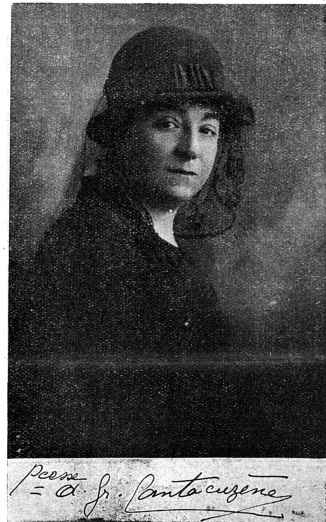
La princesse Cantacuzène, à l'activité de laquelle est due pour une bonne part le succès des femmes roumaines.

Dans le monde en désarroi dans lequel nous vivons, il se produit parfois des événements à l'allure nettement paradoxale. Du nombre est celui dont la nouvelle vient de nous parvenir par un message de la princesse Cantacuzène: la reconnaissance du droit de vote aux femmes roumaines!