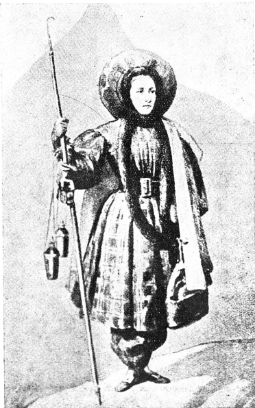
Henriette d'Angeville, « la fiancée du Mont-Blanc », en costume d'alpiniste.