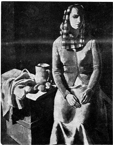
JANEBÉ : L'Epluchuse

Une jolie exposition ouverte jusqu'au 6 mai, qui vaut la peine d'une visite. L. C.