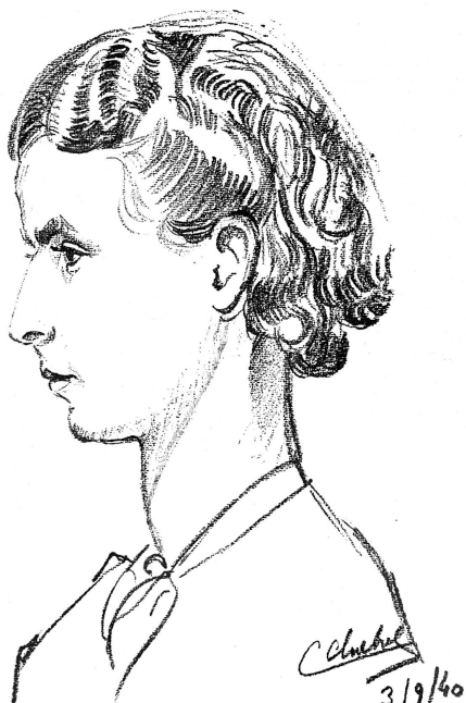
Portrait au crayon d'une jeune femme suisse par un interné français. (Voir article page suivante).

Qu'un ouvrier de l'industrie lourde reçoive, par exemple, 60 à 100 gr. d'albumine, 600 gr. d'amidon et de sucre, 60 à 70 gr. de graisse par jour,