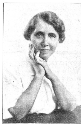
Miss Marg. HANNA Consul des Etats-Unis à Genève de 1936 à 1938.