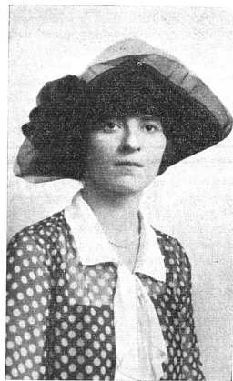
Miss Lucile ATCHERSON Vice-Consul des Etats-Unis à Berne, (1922) puis à Panama.