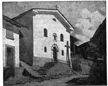
Cliche Pro Infirmis

Eug. HAINARD - BÉCHARD (Genève) Eglise de Montagne