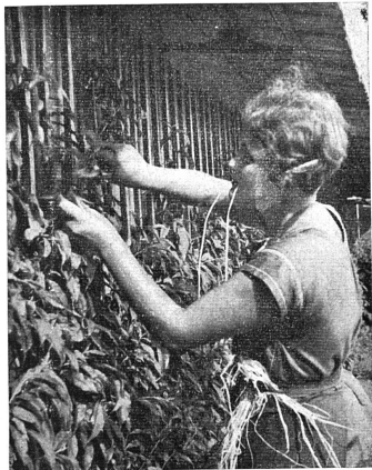
Cliché La Corbière (Estavayer)

Non seulement c'est là l'élément essentiel de la réussite, mais cela permet de surmonter les revers inévitables.