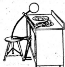
Si vous êtes assise trop bas, vous vous fatiguez plus qu'en restant debout.