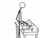
Surveillez-la donc avec un tabouret !