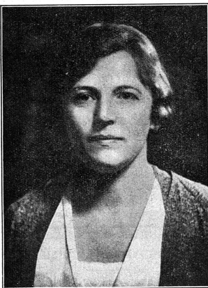
Cliché Mouvement Féministe Pearl BUCK

Et voilà pourquoi il faut partout des femmes expertes en ces diverses disciplines; or pour devenir expertes, il faut avoir conquis des grades universitaires qui attestent les études accomplies. Sans les femmes professionnelles des carrières libérales, il n'y aurait plus, de nos jours, que des hommes pour décider en haut lieu de la quantité de graisse ou de savon, qui sera attribuée à chaque ménage, pour juger de l'orientation qu'on donnera à l'éducation des enfants, de la nécessité d'octroyer aux gardes-malades un horaire supportable, pour établir les lois concernant les enfants mineurs ou les femmes employées dans l'industrie... on pourrait citer des exemples à l'infini.