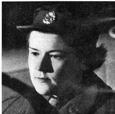
Cliché Mouvement Féministe.

Une autre A. T. S. typiquement anglaise, héroïne du film: « Aux armes! Citoyennes! »