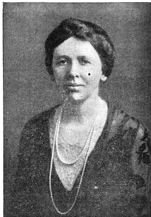
Miss Ruth WOODSMALL (Etats-Unis)

Mouvement de femmes: très vite l'Alliance a senti ses responsabilités à l'égard de toutes les femmes sans distinction de race, de nationalité, de religion ou de condition. C'est pour cela qu'elle a toujours cherché à collaborer avec