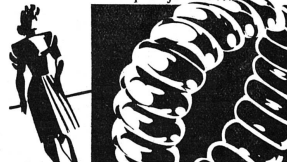
grâce à votre joli bracelet VACHERON & CONSTANTIN