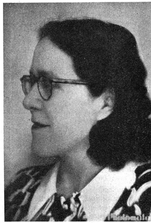
Cliché Mouvement Féministe Mme POINSO-CHAPUIS en Suisse romande

8. Afin de réaliser entre hommes et femmes une collaboration durable basée sur la confiance, l'objectivité et la loyauté, il y a lieu de renforcer les organisations professionnelles féminines, de stimuler la participation active des femmes dans les associa-