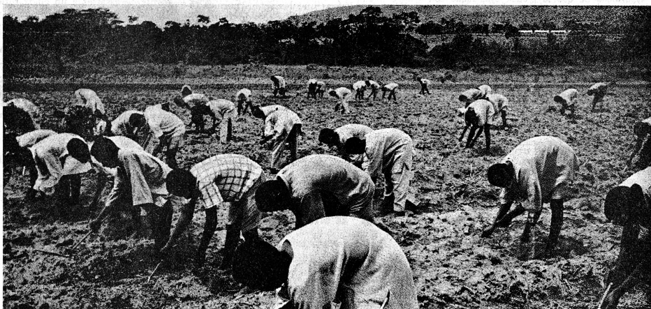
La NIGERIA a créé de fermes-écoles où les jeunes gens (ci-dessus) apprennent les techniques alimentaires modernes. Ce pays a compris que, pour rester en rapport avec la poussée démographique, la production alimentaire doit tripler d'ici la fin du siècle. Voir, à ce propos, notre page 6.

lacune regrettable de la loi. On objecte que la femme a droit, en compensation, lors de la liquidation du régime matrimonial, à une part du bénéfice réalisé par l'union conjugale. Outre que cette part n'est pas équitable dans ces cas-là, cette compensation peut être