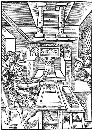
Marque de Jehan de Roigny, fameux imprimeur qui travailla à Paris, de 1529 à 1565. Il avait épousé une des filles de Josse Bade, imprimeur également. C'est une femme compositrice qui est à la casse.

Ces quelques informations sur l'histoire de la femme dans la typographie (cette histoire n'est pas encore écrite, avis aux historiennes) permettent de constater que la récente admission des jeunes filles à l'apprentissage de la typographie n'est qu'un retour tardif à une situation vieille de plusieurs siècles et qui avait subi une éclipse fort peu justifiée.