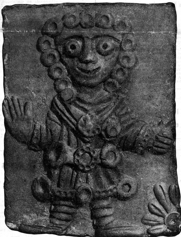
Belle terre cuite d'André Derain : Femme aux médailles